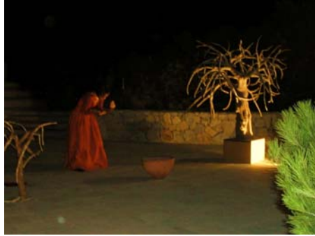
Terra Roja, Sa Creu. Santa Ponça 08